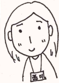
略歴：広島県SSW、他市SSW、保育SW

SSW はまだまだ皆さんに馴染みがないと思いますが、1年間よろしくお願ひいたします。