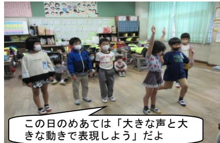
この日のめあては「大きな声と大きな動きで表現しよう」だよ

練習場所を分けて、パートごとに練習しています。職員室や体育館の外までとてもハリのある良い声が響いてきたので、練習を見に行行ってパチリ。めあてを持って頑張る姿に、4月からの成長をきっと感じていただけることでしょう。