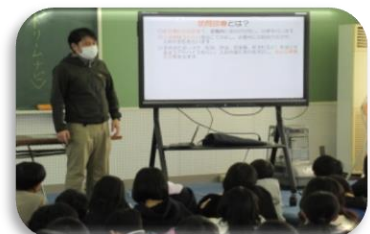
ホームケアクリニックもみじ 山科院長先生とスタッフの皆様