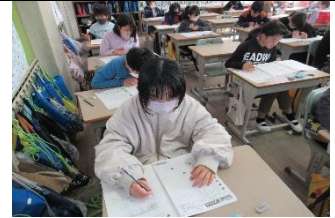
「標準学力調査」…国語と算数の学力調査。90分間頑張りました。