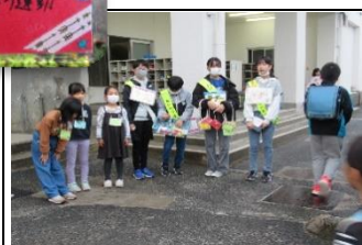
5・6年「委員会紹介」…6年生が5年生に委員会の仕事について説明しました。南小の伝統が引き継がれています。