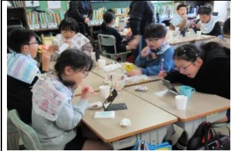
4年「歯科ブラッシング指導」…4年生が、歯の正しい磨き方を学びました。歯垢を赤く染め、磨き残しをシャカシャカ!