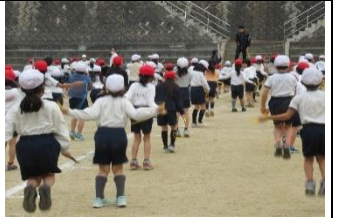
「体育朝会」…体育委員の手本を見て、色々な跳び方に挑戦!