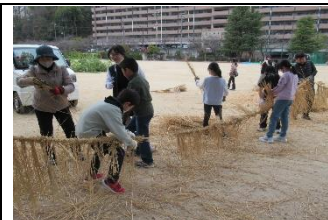
「とんど祭り」…はかま編みボランティアが頑張りました。