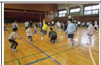
今年度最後の「縦割り班遊び」…3年生が総合の時間に作った「府中町カルタ」で、仲良く遊びました。けんかゼロに拍手！