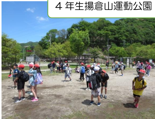
4年生揚倉山運動公園