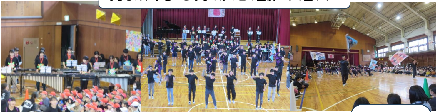
♪栄光の架橋 で退場です。 涙ぐんでいる 6年生さんも いました。