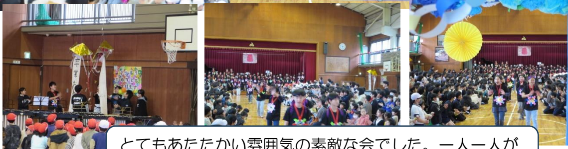
とてもあたたかい雰囲気素敵な会でした。一人一人が 一生懸命取り組んだからこそですね。さすが南っこ！