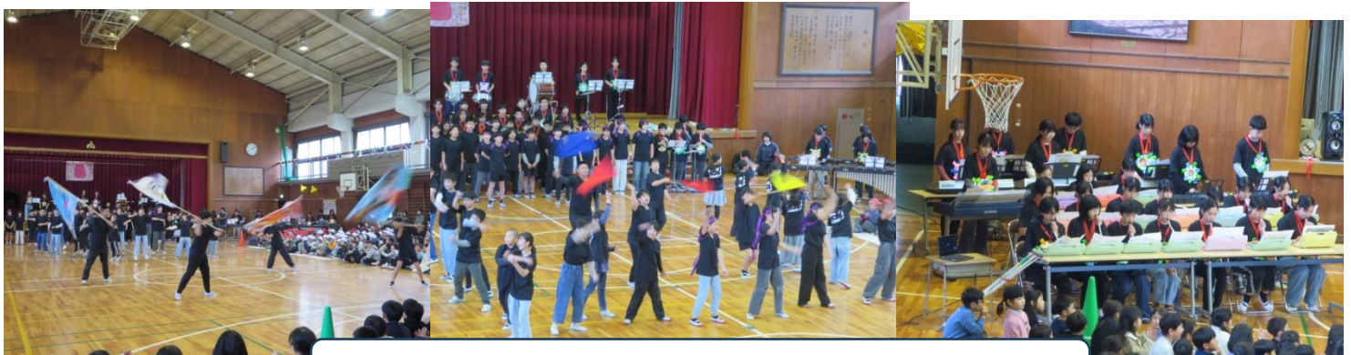
もちろんトリをつとめるのは本日の主役 6年生！！