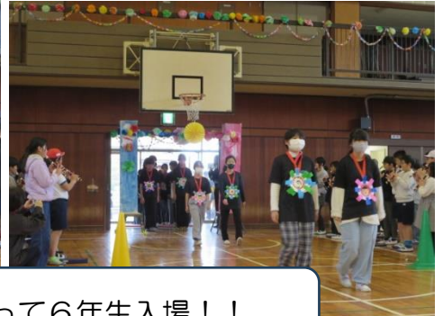
♪威風堂々♪にのって6年生入場！！