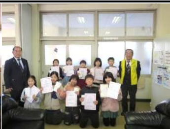
環境啓発ポスター