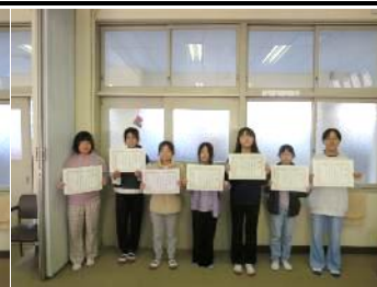
府中町 ポップコンテスト