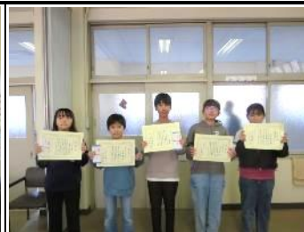
税に関する 絵はがきコンクール